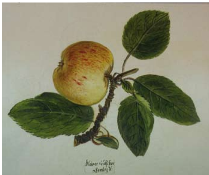
Kleiner Gewürzapfel aus Christs Pomologie.