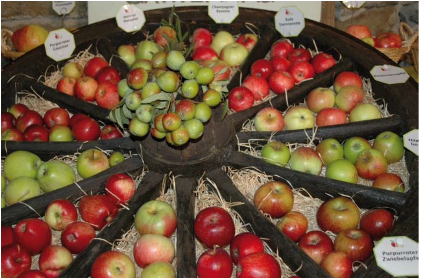
150 der ausgestellten Apfelsorten sind aus Kronberg.