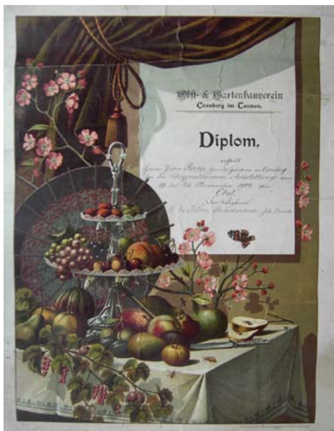
Diplom des OGV.

Als Johann Ludwig Christ 1786 sein Amt als Pfarrer antrat, war Kronberg bereits ein bevorzugtes Obstanbaugebiet. Pfarrer Christ erkannte die bevorzugte Lage am Taunushang