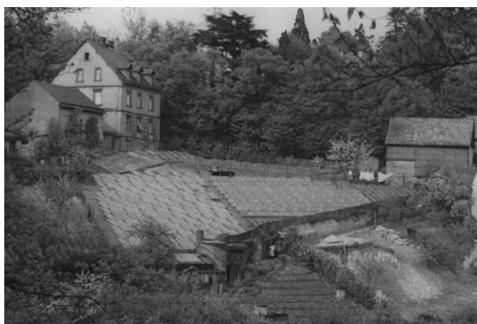
Treiberdbeeren der Gärtnerei Buchsbaum.